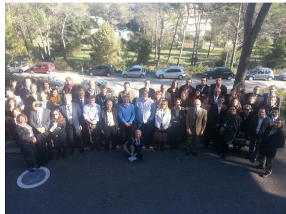
Photo 1 : Photo de groupe - Ateliers de consultation, Sophia-Antipolis, France, le 20 novembre 2014

Réunissant environ 60 parties prenantes et experts, une série d'ateliers de consultation a été organisée les 19-20 novembre 2014, au siège du Plan Bleu (Sophia-Antipolis, France), immédiatement après la fin du processus de consultation en ligne. A partir d'une approche participative, ces ateliers se sont déroulés sous la forme de petits groupes de travail, tout en étant nourris par les résultats de la consultation en ligne. Parallèlement aux ateliers des GTT 1, 2, 3 et 4, l'expert en charge du thème Gouvernance a animé une session interactive avec un groupe restreint de parties prenantes qui avait contribué à la consultation en ligne.